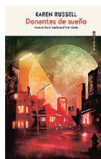
«Donantes de sueño» Karen Russell SEXTO PISO 180 páginas, 19,90 euros

El autor es un hombre de imaginación prolífica. En esta ocasión ha imaginado una historia muy original sobre una civilización que surge a raíz del accidente de una misión espacial. Todo está contado, de manera peculiar, a través de la voz de un arqueólogo. A través de él, y de los documentos que lo rodean, se irá recomponiendo esta sutil obra futurista.