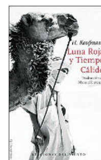
«Luna roja y tiempo cálido» Herbert Kaufmann EDICIONES DEL VIENTO 232 páginas, 19 euros

Ahora, que conciliar el sueño se ha convertido en una pesadilla para muchos, esta novelista se ha sacado de la manga un argumento interesante: una plaga de insomnio que sacude de costa a costa a Estados Unidos. Un relato que, más allá de sus desvelos, en realidad sobre lo que indaga es en la naturaleza humana y en nuestra capacidad de empatizar.