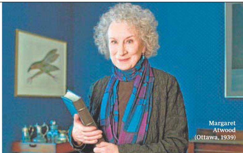
Margaret Atwood (Ottawa, 1939)

una de las ciudades europeas más desconocidas, por no decir ignoradas injustamente. Roán parece reconocer a un anterior yo en medio de tanta nostalgia y melancolía que, sin embargo, no ha parado el bullicio de una ciudad de una vitalidad desbordante. El libro va acompañado de un montón de magníficos dibujos realizados por el autor. Por otra parte hay que destacar la labor encomiable de la Editorial Báltica dedicada a dar a conocer a una de las partes de Europa más importantes y desconocida. ■