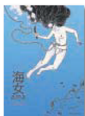
Ama. El aliento de las mujeres Franck Manguin / Cécile Becq Nórdica, 2023 112 páginas 22,50 euros ★★★★★

Al cómic europeo le 'tira' mucho Japón. Ya sea por aquello del orientalismo, ya sea que se nos hace la boca agua al ver un país donde los tebeos verdaderamente se venden bien, el caso es que –aún sin contar los muchos autores cuyo estilo de dibujo se basa directamente en el del 'manga'– cada poco se publica algún cómic de autor francés, belga, italiano, español... que trata acerca del país nipón. A veces son cómics autobiográficos sobre las vivencias del autor por aquellas tierras del Sol Naciente, como los 'Cuadernos japoneses' de Igort o 'La joven y el mar', de Catherine Meurisse.