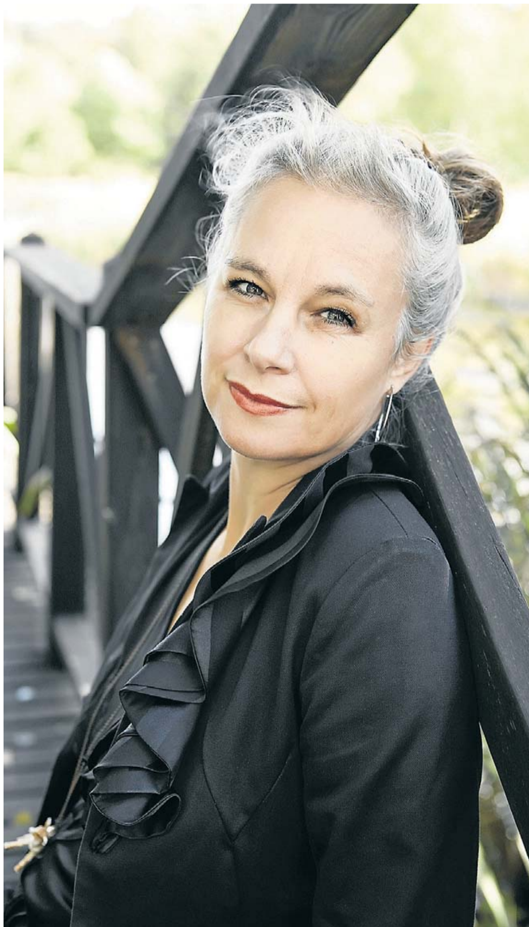
IRMELIE KREKIN / NÓRDICA

Quan vaig decidir escriure el llibre, molta gent em va avisar que no ho fes perquè era massa cruel i era tot el contrari d'allò a què estem acostumats. A la literatura i les sèries de televisió que consumim constantment, els cossos de les dones que han estat víctimes desapareixen ràpidament de la fotografia. L'interès se centra en trobar “l'intel·ligent i fascinant” assassí. Vaig pensar que si tanta fascinació hi havia pel crim, jo oferiria un crim, però el lector hauria de quedar-se al bosc amb el cos destrossat de la víctima. I hauria de tornar-hi constantment, i al moment de l'assassinat. Em volia venjar de l'exhibició constant de dones víctimes d'assassinats. L'altre fet que em va impulsar a escriure la novel·la va ser una imatge que vaig veure el 2010 dels presoners de Guantána-