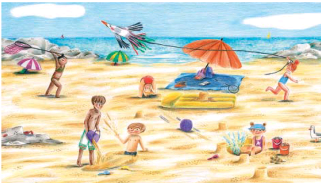
Ilustración del libro Vamos a la playa (Akiara Books), de Verónica Fabregat.