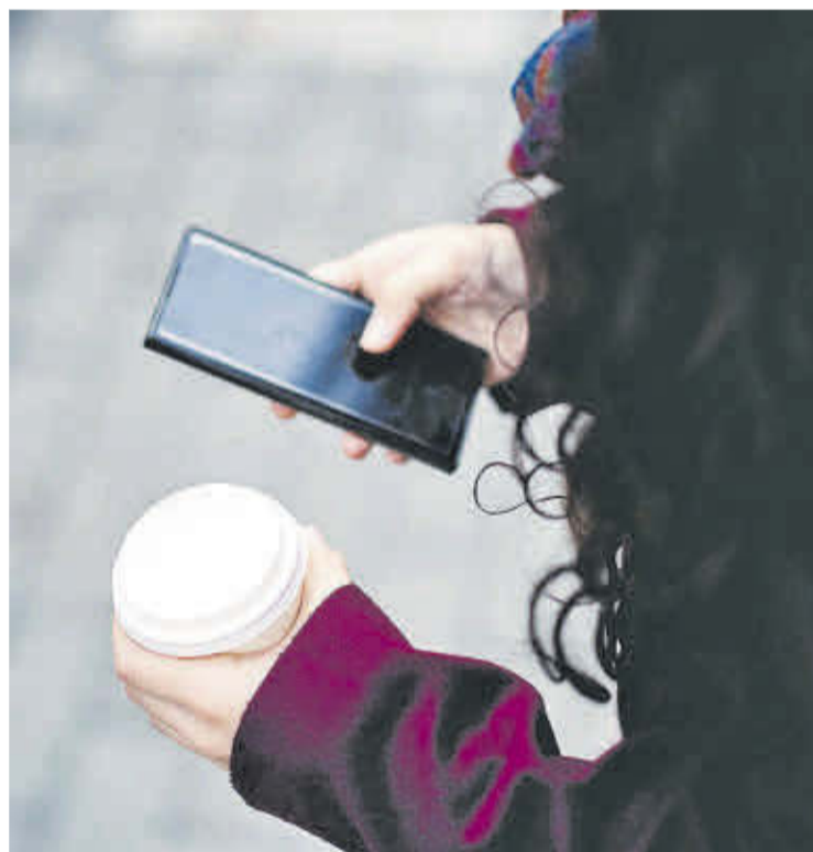
Una joven mira el móvil por la calle.

«Tardé un poco en darme cuenta de que internet se había comido mi vida», confiesa en el libro. «A veces pienso que he pasado una parte tan sustancial de mi vida en las redes que en realidad fui educada por internet. He olvidado dónde están los límites, dónde termina la tecnología y dónde empiezo yo. ¿Soy una mutante?», se pregunta en Desconexión , una fascinante colección de ensayos autobiográficos, el enésimo ejemplo de una tendencia literaria en ascenso en los últimos tiempos y de marcado carácter femenino: la revelación del lado oscuro de internet.