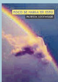
'Poco se habla de esto'