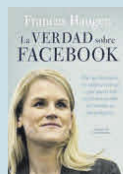
'La verdad sobre Facebook'