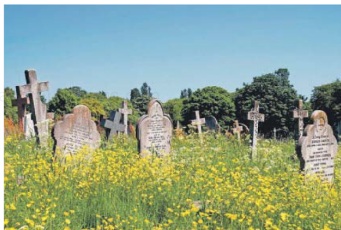
Lápidas en el cementerio de Kensal Green, en Londres.

Sergio Álvarez Navona, 2023 176 páginas. 20 euros