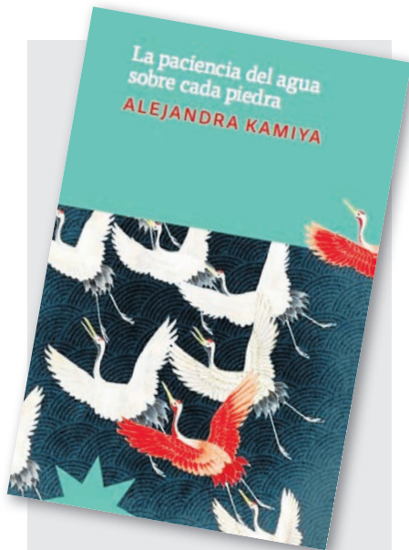
LA PACIENCIA DEL AGUA SOBRE CADA PIEDRA ALEJANDRA KAMIYA Editorial Eterna cadencia, 2023

Como una nueva e importante revelación en el concurrido terreno del relato argentino figura ya, todavía con obra más bien escasa, la bonaerense Alejandra Kamiya con apenas tres o cuatro recopilaciones cuentísticas la última de las cuales es La paciencia del agua sobre cada piedra (Ed. Eterna cadencia, 2023), integrada por un total de dieciséis textos de distinta extensión, temática y personajes; entre estos últimos no faltan recuerdos a la vida, la cultura y el pensamiento japonés al que perteneció su familia paterna. El citado título convoca una síntesis de lirismo, contemplación y pensamiento que, por lo demás, fluyen por la mayoría de los textos.