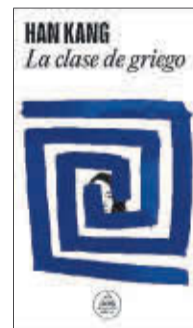
La clase de griego La classe de grec Han Kang Random House / La Magrana 19,90 €

En Seúl, una mujer recibe clases de griego antiguo. Su profesor le pide que lea en voz alta, pero ella permanece en silencio; ha perdido la capacidad del lenguaje, así como a su madre y la custodia de su hijo. Su única esperanza de recuperar el habla es aprendiendo una lengua muerta. La autora de La vegetariana indaga en la pérdida, la violencia y la frágil relación de nuestros sentidos con el mundo.