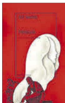
Fragua Ali Smith Nórdica 19,50 €

Un día, en el Reino Unido posterior al Brexit y en mitad de la pandemia de covid-19, la artista Sandy Gray recibe una llamada inesperada de una conocida de la universidad, Martina Pelf. Esta le pide ayuda con una pregunta misteriosa que le han hecho después de pasar medio día encerrada en una habitación por los oficiales de control fronterizo sin ninguna razón que pueda comprender.