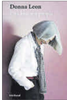
Una historia propia La meva pròpia història Donna Leon Seix Barral / Edicions 62 19,50 €

De su infancia a sus experiencias en el Irán de la revolución, China o Arabia Saudí, Donna Leon narra en este libro una vida extraordinaria en la que las aventuras superan a cuanto pudo imaginar. Con su llegada a Venecia, sumerge al lector en la que será una historia de amor de décadas con Italia, desde su búsqueda del capuchino perfecto hasta las tácticas de las abuelas que compran en el mercado de Rialto.