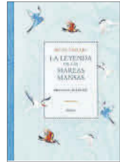
La leyenda de las mareas mansas Irene Vallejo Siruela. 19,95€