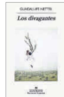
Los divagantes Guadalupe Nettel Anagrama 17,90 €

Los ocho relatos contenidos en Los divagantes transitan entre el realismo y la fantasía y enfrentan a sus personajes con esa obsesión que nuestra sociedad ha cincelado con esmero: la del éxito y el fracaso. Cuentos con protagonistas confrontados con lo desconocido y con sus propios miedos, que evidencian la maestría que Guadalupe Nettel ha alcanzado en el género de la narrativa breve.