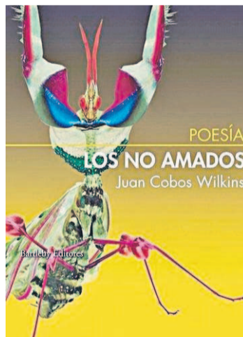
Portada de ‘Los no amados’

“Expresión ágil, directa y, a la vez, cargada de lirismo, de temblor emocional” (Manuel Rico)