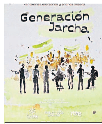
Cartel de ‘Generación Jarcha’.

Ahora, medio siglo después, la formación actual convoca un concierto (Jarcha 5.0) a sus antiguos componentes.