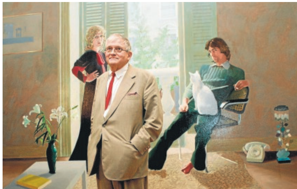
El pintor David Hockney en una imagen de archivo