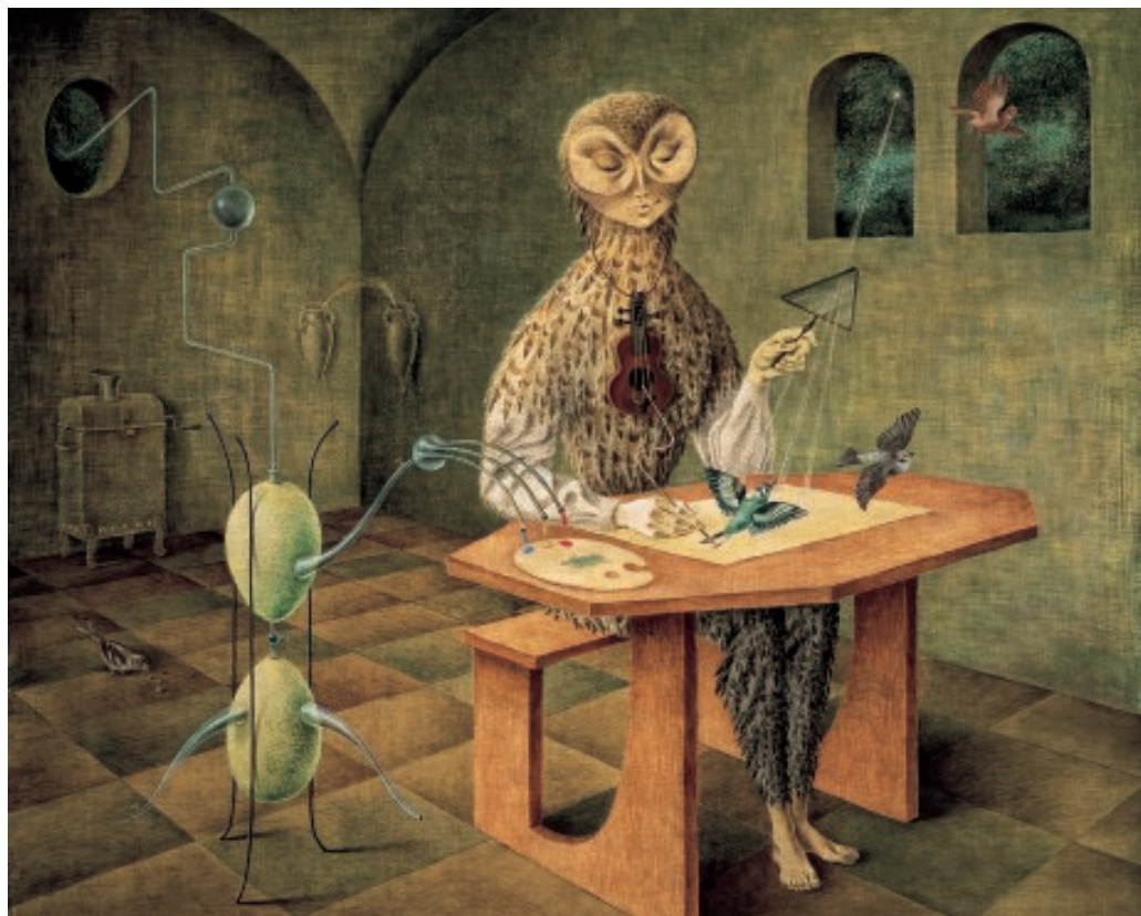
'Creación de las aves' (1957), de Remedios Varo