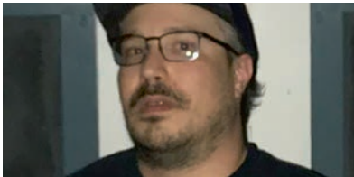
LA CAJA NEGRA

Varios ejes vertebran las mejores novelas internacionales del año: los amores imposibles, por platónicos y desesperados (Barnes), la vuelta a un pasado que alberga tanta oscuridad (O’Farrell, Ian McEwan) como momentos de felicidad (Fosse), crímenes (Bret Easton Ellis, Benjamin Black, Yeager), intrincadas conjuras (Lemaitre), el despertar del capitalismo (Follett) y su agonía (Hernán Díaz) o una sutil nostalgia.