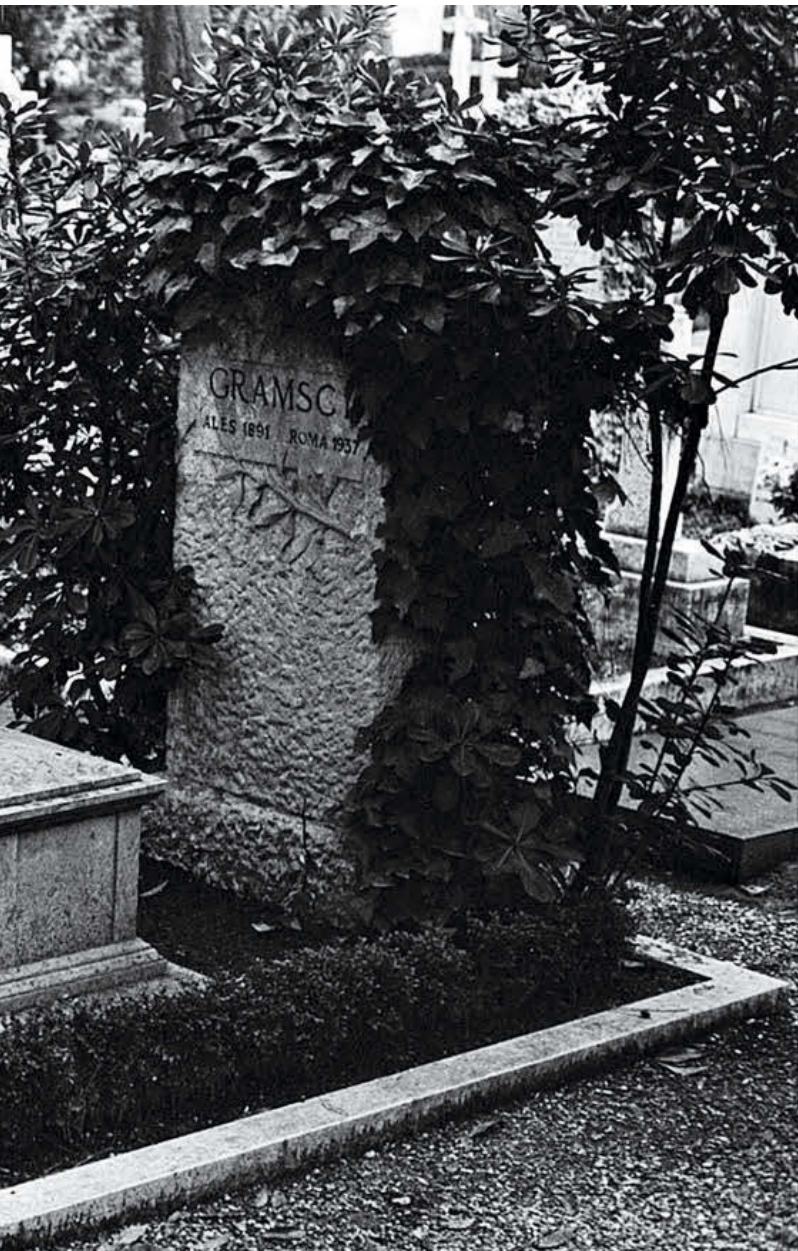
PASOLINI ANTE LA TUMBA DE GRAMSCI, HACIA 1970.

En los años 70 del siglo XX, la génesis de nuestro mundo exigió la extinción de la inteligencia de Pasolini aunque fuera a palos