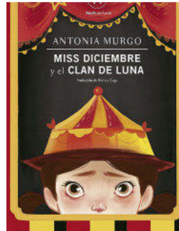
De la editorial Nórdica es este libro.