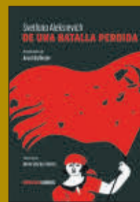
'De una batalla perdida'

La ucraniana Premio Nobel de Literatura 2015, presenta esta historia sobre los recuerdos de la infancia. La protagonista vivía en un pueblo y recrea esa fotografía de mujeres sin maridos ni padres ni hermanos. "No recuerdo que hubiera hombres en el pueblo. Después de la Segunda Guerra Mundial, en Bielorrusia, pereció uno de cada cuatro bielorrusos. Nuestro mundo infantil era un mundo de mujeres".