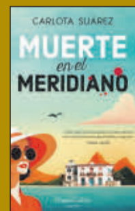
'Muerte en el meridiano'

Alicia Giménez Bartlett Destino 440 páginas Precio: 18,90 €