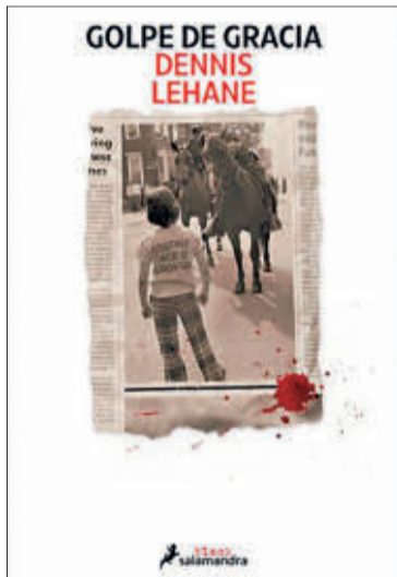
Portada de su nuevo lanzamiento.