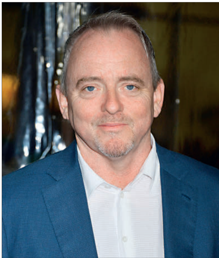
Lehane, de 59 años, recrea un crimen que atormentó Boston en 1974. EE

Ambientada en los tumultuosos meses de la desegregación de los