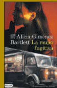
'La mujer fugitiva'

Regresa la inspectora que cuenta con más de dos millones de lectores en el mundo. Junto a Delicado está el subinspector Fermín Garzón . Ambos, en sus pesquisas de este nuevo caso, sólo cuentan con una pista: los vecinos del escenario donde se produjo el crimen aseguran que, la tarde anterior al día de autos, una mujer hizo una compra en el negocio de la víctima. Petra y Fermín se enfrenta a un criminal que sigue sus pasos de cerca.