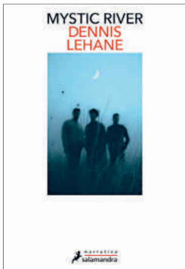
La novela que adaptó Eastwood.

colegios públicos, Golpe de gracia es un thriller completo y también una crónica de ambiente de aquellos años de racismo americano y de la lucha por la igualdad.