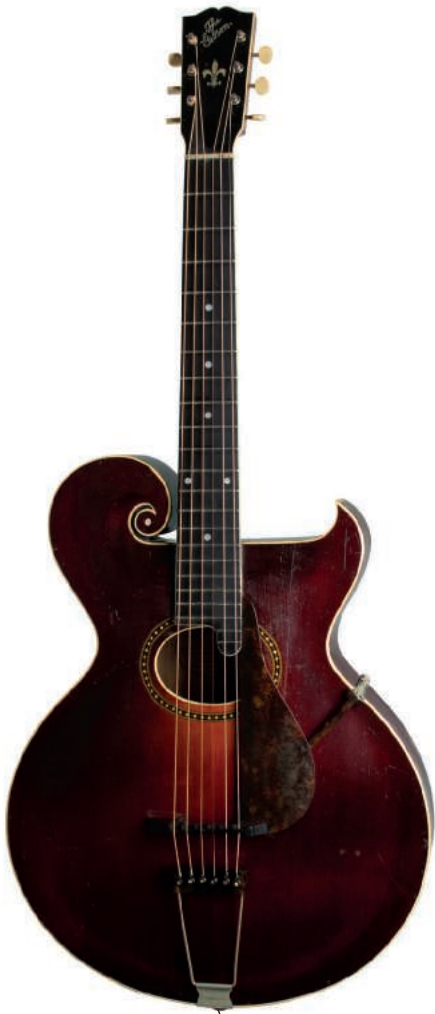
GIBSON STYLE O (1918). Acústica de cuerdas de acero y forma curva en su tapa armónica. Toma su nombre de Orville Gibson, su diseñador y fundador de la marca.