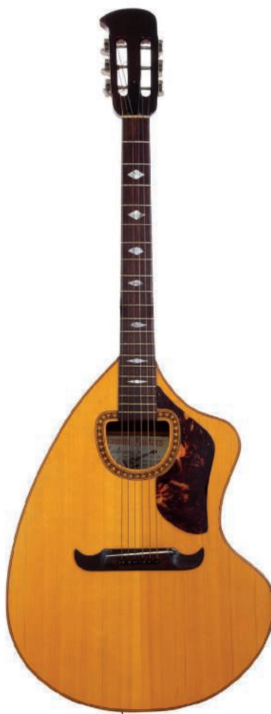
GIANNINI CRA6S CRAVIOLA (1970). Creada por el compositor y cantante Paulinho Nogueira, la Craviola es una de las guitarras más bonitas de todos los tiempos.