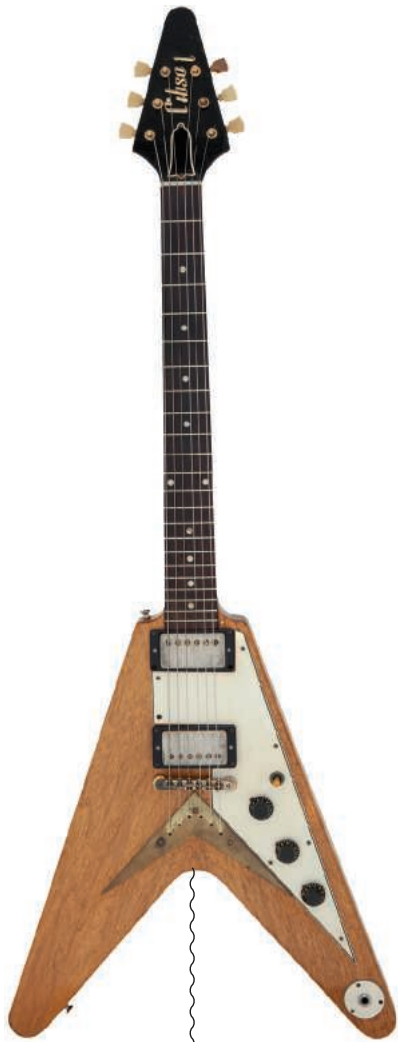
GIBSON FLYING V (1958). La más radical de las Gibson, por su diseño 'futurista', fue la favorita del cantante de blues Albert King y del de country Lonnie Mack.