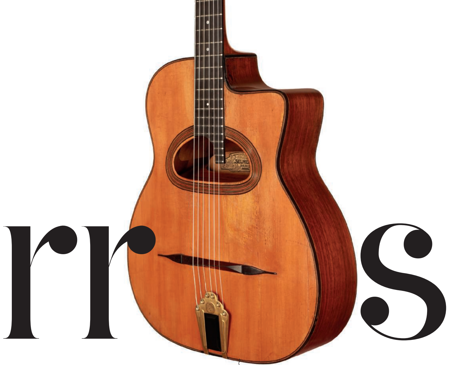
SELMER MACCAFERRI (1933). Guitarra para jazz fabricada en madera de palisandro de la India, que hizo célebre el guitarrista de jazz belga Django Reinhardt.