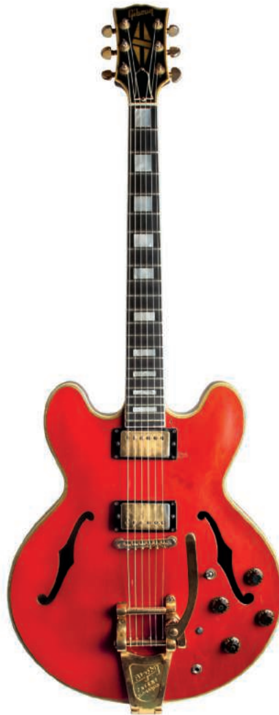
GIBSON ES-175 (1960). No es la más popular de las Gibson, pero sí lo son sus usuarios ilustres, como BB King, Izzy Stradlin (Guns & Roses) o Bono (U2).