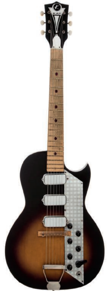
KAY VALUE LEADER (1960). Línea de gama baja producida por Kay a principios de los 60 que popularizó el famoso guitarrista de jazz Lonnie Johnson.