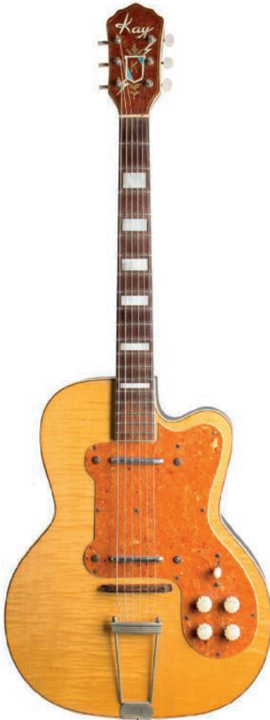
KAY THIN TWIN K161 (1955). Guitarra estrella del fabricante, conocida como Jimmy Reed , en honor al cantante de blues que inspiró a Elvis o Van Morrison.