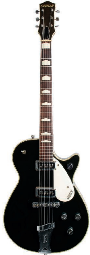
ALDENS/ HARMONY H-45 STRATOTONE (1958). A pesar de pertener a una marca desconocida, esta es una de las mejores guitarras eléctricas que se han fabricado nunca.