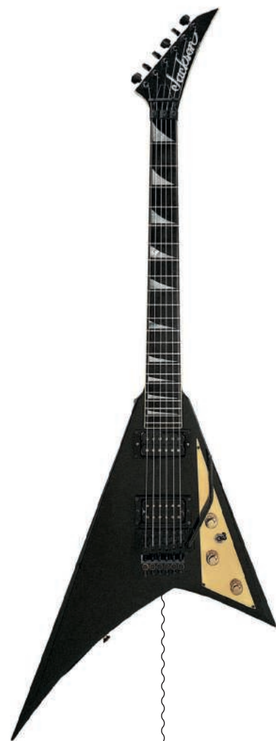
JACSON RR1 (1981). Fundada por el luthier Grover Jackson, que se especializó en piezas eléctricas para guitarristas de metal y rock, la RR1 está hecha de ébano y arce.