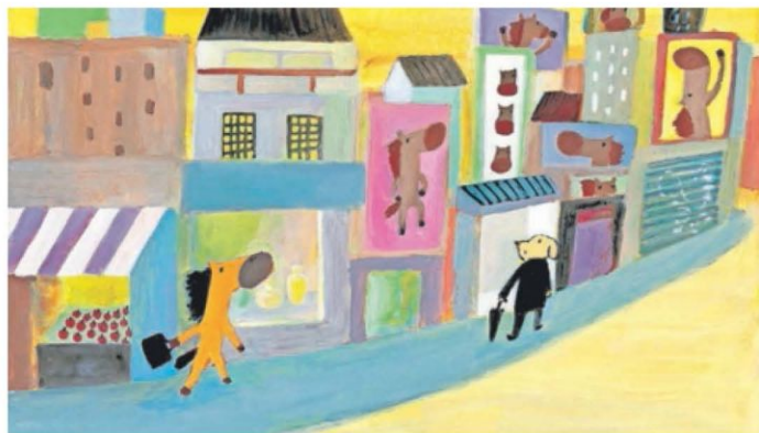
Ilustración del libro El caballo naranja (Thule Ediciones), de Hsu-Kung Liu.