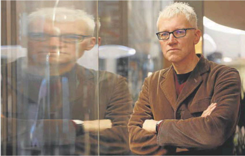
El doctor en Historia Tom Holland, durante la entrevista en un hotel de Madrid