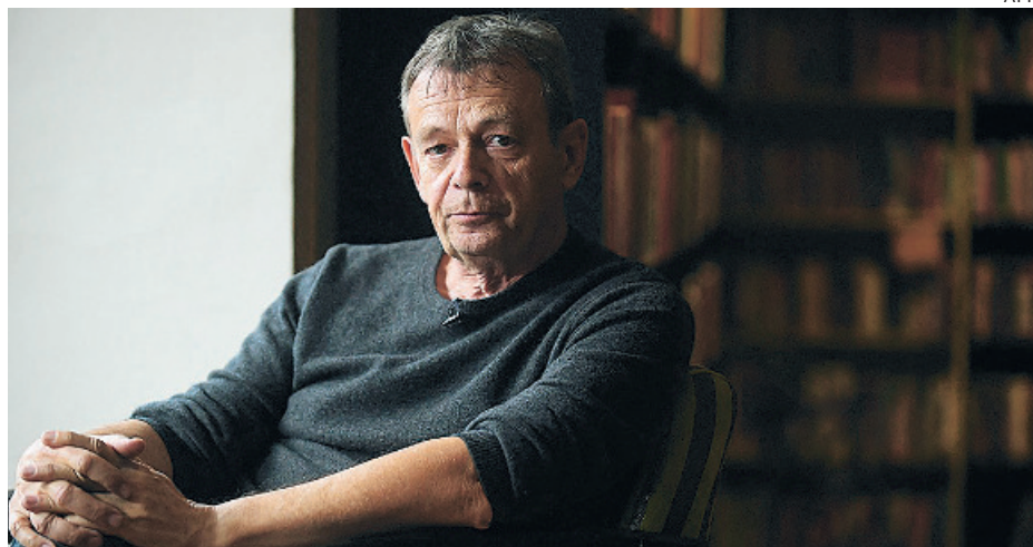
Pierre Lemaitre prosigue con su saga «Los años gloriosos»