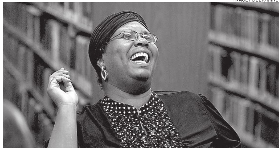
La autora Gloria Naylor se adentra aquí en los grandes problemas de Estados Unidos