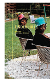
★★★★ «Linden Hills» Gloria Naylor NÓRDICA 387 páginas, 23,95 euros

Gloria Naylor (de quien también acaba de publicar su maravillosa «Bailey's Café» Arde editorial) adapta el «Infierno» de Dante en una exploración ingeniosa de las almas atrapadas en el sueño americano dentro de una comunidad negra de clase media alta. Ambientada en el ficticio Linden Hills, la novela desentraña las capas de apariencia y éxito material para exponer un inframundo de caos y desesperación. La historia arranca con el ex esclavo Luther Nedeed (léase Lucifer), cuya ambición le lleva a la creación de un próspero vecindario, «la joya de ébano». Todo había empezado con una cabaña y un negocio funerario para dar paso a un emporio inmobiliario perpetuado por sus herederos, también llamados Luther. Un logro de los negros y para los negros... cuyo dominio esconde secretos oscuros. A través de los ojos de dos poetas callejeros que buscan dinero para Navidad, Willie y Lester (léase Dante y Virgilio), los lectores somos guiados por los círculos infernales de esa comunidad donde la jerarquía social se refleja en la disposición de las casas. Así veremos cómo tras la máscara del éxito material se esconde un inframundo de desesperación.