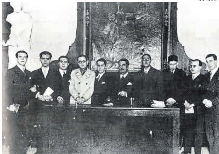
Reunión fundacional de la Generación del 27 en el Ateneo de Sevilla.

tiempo. Para un lector poco avisado, ¿es esto la literatura? ¿Es esta la poesía española de hoy? Dentro de tres años será el centenario del 27, de esa foto emblemática de la historia de la cultura. Entretanto, no sé si releer 'Un mundo feliz', de Aldous Huxley, o la 'Defensa de la poesía', de Percy B. Shelley.