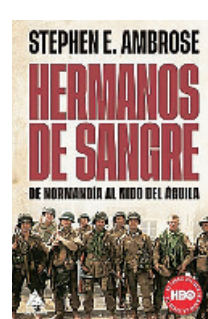
«Hermanos de sangre» Stephen E. Ambrose LIBROS DEL ASTEROIDE 426 páginas, 22,95 euros

La autora es hoy una de las más prometedoras del Este de Europa. Una novelista que se ha adentrado, a través del sentimiento de luto de su protagonista, en un territorio geográfico salpicado de cicatrices: su país, Moldavia. A través de este libro de enorme sensibilidad da testimonio de lo que ha vivido esa población y retrata a unas mujeres que sufren y viven sin quejarse.