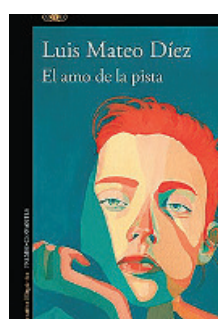
«El amo de la pista» Luis Mateo Díez ALFAGUARA 296 páginas, 19,90 euros

El reciente ganador del Premio Cervantes de Literatura es un hombre incansable. Una persona que vive por y para la creación. Nada más recibir el galardón más distinguido de las letras españolas, Mateo Díez publica esta novela inusual dentro de su carrera, que se mueve por las aguas de la marginalidad y se desenvuelve en el territorio imaginario que él ha creado.