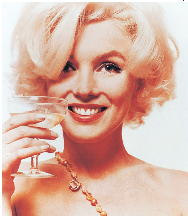
La actriz, todo un icono del cine cuya vida fue tan corta como trágica

Dedicó mucho tiempo para descubrir quién era la mujer que había detrás de la estrella que iluminó durante años las pantallas de cine. Su prematura muerte, los rumores sobre la relación que mantuvo con JFK y su turbulenta relación con Arthur Miller la convertía en una candidata exquisita para una obra.