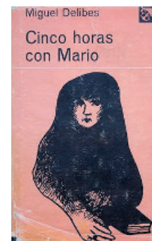
Portada de la primera edición de «Cinco horas con Mario», que se publicó en 1966