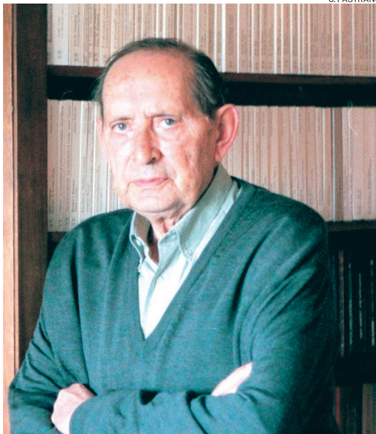
El gran escritor Miguel Delibes

Tras la salida del autor del decano de la Prensa española se consagra en escribir una de sus grandes novelas, llevada al teatro en un sinnúmero de ocasiones, «Cinco horas con Mario». No hace Delibes aquí, aunque pudiera parecerlo, un relato inofensivo, sino que carga las tintas contra la moral dominante de la época, años 50 y 60: muy conservadora, hipócrita y en-